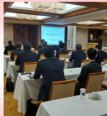
新春講演会会場風景