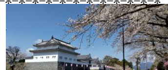
駿府城公園とさくら