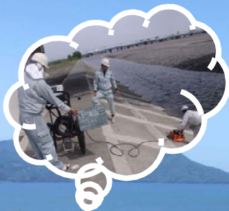
空洞調査（維持管理）