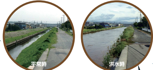
鋼矢板護岸による河道改修