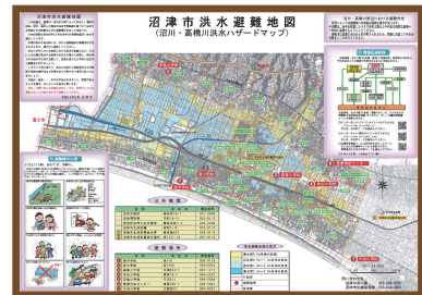
想定浸水区域や避難場所の情報提供