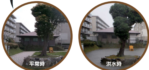
公園や校庭等を利用した雨水貯留池の整備